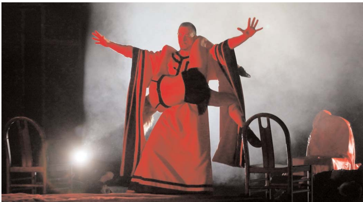
Jelenet Bartók Béla: A csodálatos mandarin című előadásából (Miskolc, 2012).

A „ Híd a jövőbe ” olyan egyedülálló operagálának ígérkezik, amely az opera műfaját eleve elvetők táborát is elvarázsolja. Kesselyák Gergely , a rendezvény fesztiváligazgatója elsődleges törekvése, miszerint operabarátokat toboroz, kétségkívül sikerrel fog járni.