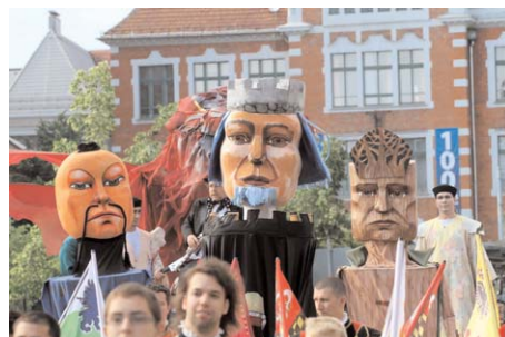
A „3Bartók” címszereplők, 2012

Az új próbálkozás célja: a fiatal nemzedék érdeklődésének felkelése az opera műfaja iránt. Különleges élmény vár azokra, akik a „ 3Bartók ” – A fából faragott királyfi, A kékszakállú herceg vára, A csodálatos mandarin – előadást tekintik meg, mivel tanúi lehetnek a látványos, mozgalmas, s néha akrobatikus mozgásvilág ( ExperiDance Táncársulat) és Bartók Béla kifejező zenéje egységének.