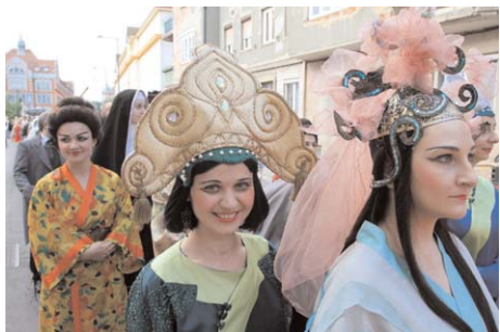
Puccini nőalakjai a nyitó napon, 2012

A 2012-es évadban Bartók + Puccini 2012 (Bartók Béla és Giacomo Puccini) művei csendülnek fel, melyeket filmen, színházban vagy a szabadban mutatnak be: a „ Tosca ” a Városház előtti téren részletekben, majd az Avasi kilátónál teljes egészében lesz hallható, látható, monumentális zenei apparátusával, a hatalmas zenekarral, s a mintegy 240 fős kórossal. Nem mindennapi látványosságnak ígérkezik „ Bohém Casting ” címmel a Bohémélet musicalváltozata. Giacomo Puccini és Giuseppe Giacosa művét újszerű átdolgozásban lehet majd hallani: napjainknak megfelelő lendületes megfogalmazás és kibővített modernizált hangszerelés találkozik a klasszikus történettel. Hangszerelés: Zsoldos Béla; magyar szöveg: Müller Péter Sziámi; libretto: Kerényi Miklós Gábor; dramaturg: Anger Ferenc.