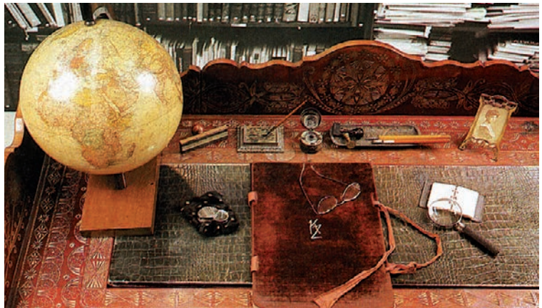
Kodály Zoltán íróasztala a kottatartóval