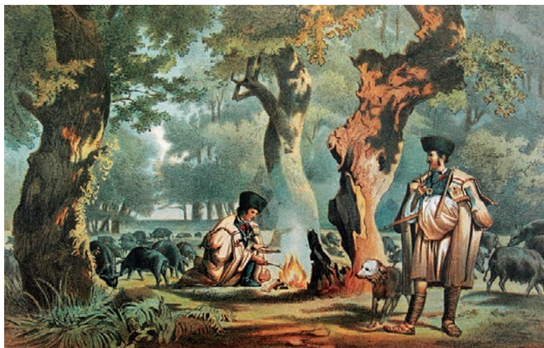
Sterio Károly: Bakonyi kanászok