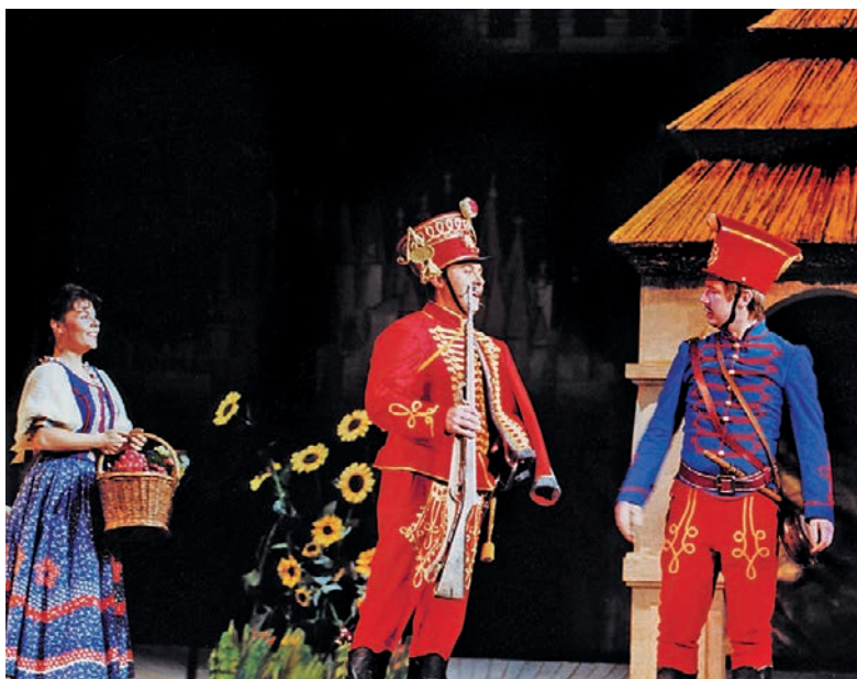
Jelenet a Hány János című daljátékból