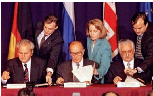
Slobodan Milošević, Alija Izetbegović és Franjo Tuđman 1995. december 14-én Párizsban a daytoni békeszerződés aláírásán