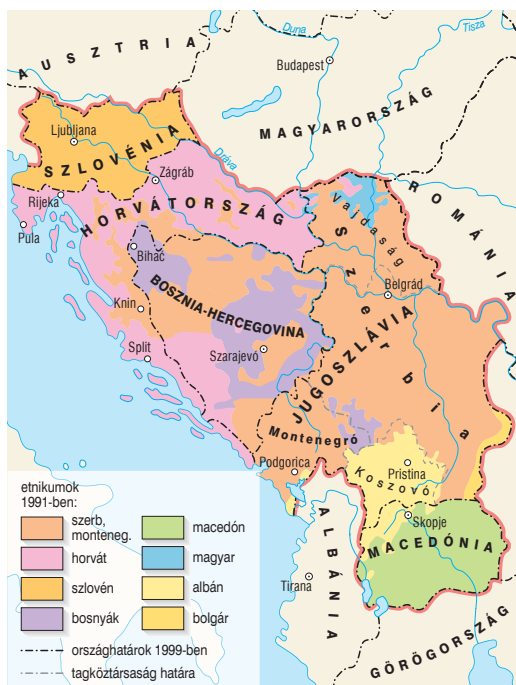
5 A Nyugat-Balkán 1991-ben és 1998-ban

háborús bűnös Hága Nemzetközi Törvényszék